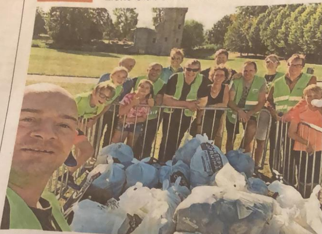
De Lions ruimden tientallen zakken zwerfvuil op. Het verzamelde afval wordt 'tentoongesteld' om mensen te sensibiliseren.

De Herzeelse Lions Club heeft op World Cleanup Day de handen uit de mouwen gesto- ken om zwerfvuil op te ruimen.