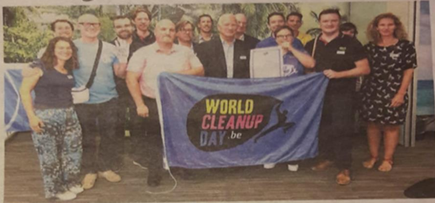
Met World Cleanup Day wil men werken aan een propere omgeving.

AALST Na het succes van vorig jaar zet JCI (Junior Chamber International) opnieuw haar schouders onder de organisatie van World Cleanup Day. En met succes: tot op heden zetten reeds 23 lokale JCI-afdelingen zich in om, verspreid over het land, op 21 september opruimacties te organiseren met in totaal ruim 3.000 opruimhelden. "Bij JCI zit Active Citizenship in het DNA. Vrij vertaald betekent dit een bijdrage leveren voor een betere maatschappij. Dat we World Cleanup Day ondersteunen, is een daaruit volgende evidentie. Iedereen wordt uitgedaagd om (letterlijk) mee de handschoen op te nemen en met leden, inwoners en werknemers mee te doen aan World Cleanup Day", legt voorzitter Pepijn